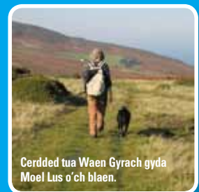
Cerdded tua Waen Gyrrach gyda Moel Lus o'ch blaen.