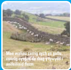
Mae waliau cerrig sych yn gallu cynnig cysgod da rhag y tywydd i anifeiliaid fferm.

Mae Castell Conwy i'w weld i'r dde gyda Chyffordd Llandudno ac yna Bryn Pydew y tu ôl iddo. Mae Ucheldir Colwyn i'w weld yn y pellter a chefn gwlad Conwy o'i amgylch.