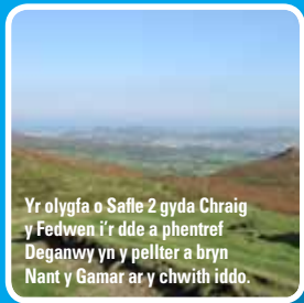
Yr olygfa o Safle 2 gyda Chraig y Fedwen i'r dde a phentref Deganwy yn y pellter a bryn Nant y Gamar ar y chwith iddo.

Y wal ar y chwith i chi yw'r terfyn rhwng y tir caeëdig a'r gweundir agored. Fe'i codwyd, yn yr un modd â waliau caeau eraill yr ucheldir, o glogfeini crwn a gasglwyd oddi ar y llechweddau wrth glirio'r caeau oedd newydd eu creu. Roedd llawer o'r gwaith wedi'i offren erbyn diwedd y 18fed ganrif. Maent yn enghreifftiau rhyfeddol o grefft yr hen godwyr waliau. Heddiw, mae'r grefft hon wedi'i hadfer wrth i ffermwyr gael cyfle i ailgodi'r waliau cerrig sych ar eu tir yn yr ardal hon dan gynlluniau stiwardiaeth cefn gwlad fel Tir Gofal.