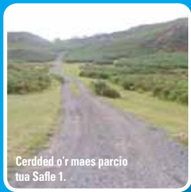
Cerdded o'r maes parcio tua Safle 1.