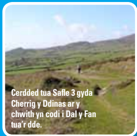
Cerdded tua Safle 3 gyda Cherrig y Ddinas ar y chwith yn codi i Dal y Fan tua'r dde.

Ychydig ar ôl y giât hon ac ar y dde i chi mae carreg drionglog sydd wedi'i phlannu yn y ddaear. Dyma Safle 3.