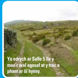
Yn edrych ar Safle 5 lle y mae'r wal agosaf at y trac a phant ar ôl hynny.

Wrth gerdded, efallai y gwelwch chi ferlod lledwyllt. Unwaith y flwyddyn, cânt eu corlannu gan ffermwyr lleol a'u rhannu er mwyn anfon rhai i arwerthiant. Pwy sydd angen côt pan mae gennych chi fwr? Mae gan y merlod gôt aeaf â dwy haen iddi. Mae hyn yn cadw gwres ac yn dal dŵr. Gall eira orwedd ar gefn y merlod am gryn dipyn o amser heb iddyn nhw wlychu nac oeri.