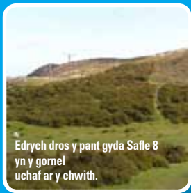
Edrych dros y pant gyda Safle 8 yn y gornel uchaf ar y chwith.