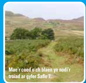
Mae'r coed o'ch blaen yn nodi'r troiad ar gyfer Safle 7.

Trowch o'ch amgylch fel bod y corlannau defaid ar eich ochr chwith a Tyddyn Grasod ar eich ochr dde. Ewch yn ôl i ddilyn y trac o'ch blaen. Ewch yn eich blaen ar hyd y trac hwn ac ewch i'r chwith lle mae'r trac yn fforchio'n ddau. Croeswch y trac mwy clir a dilyn trac/llwybr llai eglur i lawr at adfeillion tyddyn – Waen Gyrrach. Gan gadw olion y tyddyn ar y chwith, cerddwch i lawr at y coed ac at un o gyfeirbwyntiau llwybr y Gogledd a thro'i i'r dde i ddilyn llwybr y Gogledd. Dyma Safle 7.