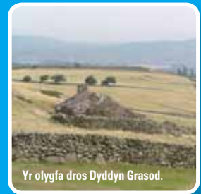
Yr olygfa dros Dyddyn Grasod.

sy'n gysylltiedig ag Eglwys Celynnin yn Llangelynnin, sy'n sefyll yn y pant sy'n rhannu'r grib. Mae'r grib yn codi eto i uchder o 610 metr ar Dal y Fan.