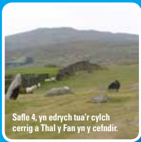
Safle 4, yn edrych tua'r cylch cerrig a Thal y Fan yn y cefndir.