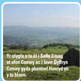
Yr olygfa o tu ôl i Safle 3 tuag at afon Conwy ac i lawr Dyffryn Conwy gyda phentref Henryd yn y tu blaen.

Mae'r garreg hon yn dangos safle hafoty o'r Canol Oesoedd. Hyd at ddiwedd y 18fed ganrif, roedd yn arfer gan ffermwyr fynd gyda'u gwartheg a'u defaid i'r tir uchel yn ystod misoedd yr haf. Gan fod angen godro'r gwartheg bob dydd, bu'n rhaid i'w perchnogion fyw ar y tir uwch mewn tai haf syml (hafotai). Wrth i'r gaeaf ddynesu, byddent hwy a'r anifeiliaid yn symud yn ôl i'r tai gaeaf ar y tir isel (yr hendy neu'r hendref). Trawstrefa yw'r enw ar y mudo blynyddol hwn. Wrth i ddefaid gymryd lle gwartheg ac wrth amgáu tiroedd y mynydd tua diwedd y 18fed ganrif, nid oedd angen bellach am hafotai a thrawstrefa. Mae seiliau'r hafotai hyn yn gyffredin ar y llechweddau uchaf, yn enwedig ger Eglwys Llanelynnin, y gellir ei gweld wrth graffu ar lechweddau Cerrig y Ddinas.