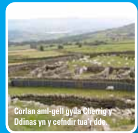
Corlan aml-gell gyda Cerrig y Ddinas yn y cefndir tua'r dde.