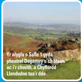
Yr olygfa o Safle 1 gyda phentref Deganwy o'ch blaen ac i'r chwith, a Chyffordd Llandudno tua'r dde.

Parhewch i gerdded fyny'r prif drac, heibio i droiad i'r chwith nes eich bod wedi cyrraedd brynau ar y naill ochr a'r llall. Fe welwch glogfaen fechan ar eich ochr dde ar gyffordd gyda llwybr troed. Dyma Safle 1.